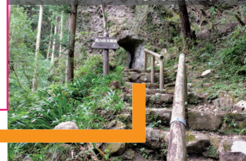
萬力坊・手掘隧道